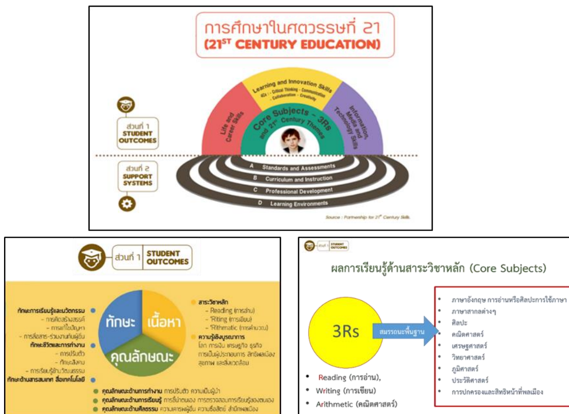
ภาพที่ 1 การศึกษาในศตวรรษที่ 21

ความสามารถพื้นฐานที่ใช้เป็นกรอบในการประเมินคุณภาพผู้เรียน (NT) นี้ เป็นความสามารถที่วิเคราะห์มาจากหลักสูตรแกนกลางการศึกษาขั้นพื้นฐาน พุทธศักราช 2551 กำหนดแนวทางในการประเมินคุณภาพผู้เรียน ว่าเป็นการประเมินคุณภาพผู้เรียนตามมาตรฐานการเรียนรู้ (กระทรวงศึกษาธิการ, 2551) สถานศึกษาต้องจัดให้ผู้เรียนทุกคนที่เรียนในชั้นประถมศึกษาปีที่ 3 เข้ารับการประเมิน ตามความสมัครใจ รวมทั้งแนวคิดในการจัดการเรียนรู้ในศตวรรษที่ 21 ที่กล่าวว่าความสามารถพื้นฐานเปรียบเสมือนเครื่องมือในการเรียนรู้ เนื้อหาความรู้เชิงบูรณาการ โดยในศตวรรษที่ 21 ได้ระบุสมรรถนะพื้นฐานที่จำเป็นในการเรียนรู้ 3 ด้าน (3Rs) ได้แก่ การอ่าน (Reading) การเขียน (Writing) และคณิตศาสตร์ (Arithmetic) ดังภาพ