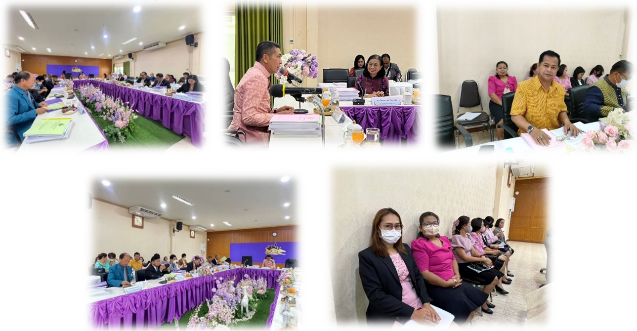
ภาพที่ 5 ประชุมคณะกรรมการศึกษาธิการจังหวัดชัยภูมิ พิจารณาร่างแผนพัฒนาการศึกษาขั้นพื้นฐาน (พ.ศ.2566-2570) ของสำนักงานเขตพื้นที่การศึกษาประถมศึกษาชัยภูมิ เขต 3