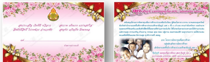
ภาพการ์ดอวยพรวันเกิดระดมทุนช่วยเหลือนักเรียน

โครงการจัดหาทุนเพื่อการศึกษา “กองทุนเพื่อการศึกษา สพ.ชัยภูมิ เขต 3” ระดมและ จัดหาทุนจากคณะผู้บริหารครู และ บุคลากรทางการศึกษาในสังกัดจัดตั้ง เพื่อช่วยเหลือนักเรียนประสบภัยต่าง ๆ และสนับสนุนกิจกรรมนักเรียน เรียนดี กีฬาเด่น และอื่น ๆ ตามความเหมาะสม ตั้งแต่ปี 2553 ถึงปัจจุบัน ระดมทุนโดยการจัดทำการ์ดอวยพรเนื่องในวันคล้ายวันเกิดเพื่อสร้างขวัญและกำลังใจแก่บุคลากร สังกัด ซึ่ง สามารถทำบุญและสบทบทุนช่วยเหลือนักเรียนที่ยากจน ด้อยโอกาส และขาดแคลนทุนทรัพย์ ให้มีคุณภาพ ชีวิตที่ดีขึ้น ร่วมบริจาคเป็นเงินสด หรือโอนเข้าบัญชีธนาคารออมสิน ประเภทออมทรัพย์ เลขที่บัญชี 020013189996