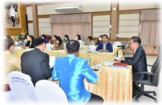
ภาพที่ 1 ประชุมคณะกรรมการดำเนินการจัดทำแผนปฏิบัติการประจำปีงบประมาณ พ.ศ.2566 ครั้งที่ 3/2566

4.2 กิจกรรมที่ 2 ดำเนินการจัดทำคำขอตั้งงบประมาณ งบลงทุน ค่าครุภัณฑ์ ที่ดินและสิ่งก่อสร้าง ประจำปีงบประมาณ พ.ศ.2567 โดยได้แต่งตั้งคณะกรรมการพิจารณาจัดตั้งงบประมาณปีงบประมาณ พ.ศ. 2567 งบลงทุน ค่าครุภัณฑ์ ที่ดินและสิ่งก่อสร้าง ดำเนินการจัดประชุมเพื่อทำคำขอตั้งงบประมาณ จำนวน 3 ครั้ง ดังนี้