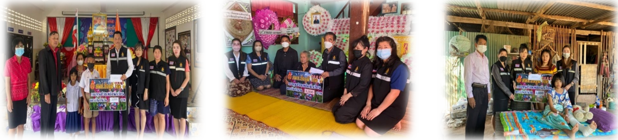
ภาพการระดมทุนบริจาคและมอบทุนช่วยเหลือนักเรียน

4.1.3) กองทุนเพื่อฟื้นฟูดูแลความปลอดภัยและช่วยเหลือ การบริหารกองทุนดูแลช่วยเหลือนักเรียน ในกรณีเหตุต่าง ๆ อาทิ ประสบอุบัติเหตุ อุทกภัย ภัยหนาว เจ็บป่วยด้วยเหตุอื่น ๆ ปัญหาด้านจิตใจและ สุขภาพจิตตามความเหมาะสมจำเป็น ระดมทุนบริจาคทำบุญวันเกิดเพื่อกองทุนช่วยเหลือนักเรียน