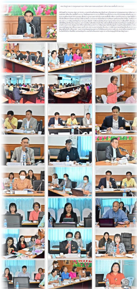
คณะกรรมการติดตาม ตรวจสอบ ประเมินผลและนิเทศการศึกษา (ก.ต.ป.น.) สปป. จั๊นญี เซด