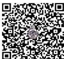
คู่มือการจัดการสิ่งแวดล้อมฯ

๓.๗.๑ ด้วย สพฐ. กำชับขอความร่วมมือให้โรงเรียนดูแลห้องน้ำให้สะอาดอยู่เสมอเป็นการส่งเสริมสุขภาพของนักเรียน และบุคลากรในโรงเรียน โดยให้โรงเรียนปฏิบัติตามคู่มือการจัดการสิ่งแวดล้อม ลดความเสี่ยงสุขภาพ ของ กรมอนามัย กระทรวงสาธารณสุขอย่างเข้มงวด รายละเอียดตาม QR Code นี้