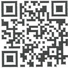
สมัครแข่งขัน

สอบถามรายละเอียดเพิ่มเติมได้ที่ หมายเลขโทรศัพท์ 091-0519815 , 091-0529178 ในวันและเวลาราชการ