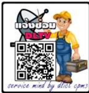
QR Code เพื่อแจ้งซ่อม DLTV

ตามที่โรงเรียนขนาดเล็ก ได้รับจัดสรรอุปกรณ์จัดการเรียนการสอนทางไกลผ่านดาวเทียม (DLTV) เพื่อใช้ในการจัดการเรียนการสอน แต่ไม่สามารถใช้งานได้ เนื่องจากไม่มีสัญญาณ โรงเรียนสามารถประสานขอความช่วยเหลือและแจ้งปัญหา ผ่านระบบออนไลน์ ที่เว็บไซต์ https://www3.chaiyaphum3.go.th/dlict/ หรือได้ที่กลุ่มส่งเสริมการศึกษาทางไกลฯ โทร ๐๔๔ ๐๕๖๓๘๕ ต่อ ๑๐๘ หรือ นายศุภศิษย์ พิทยศักดิ์ ๐๘๗ ๘๖๙๓๔๓๔ , นางสาวธัญญา สุปโคกสูง ๐๘๙ ๙๑๗๙๙๗๗ หรือไลน์ กลุ่ม DL-ICT สพป.ชัยภูมิ เขต ๓