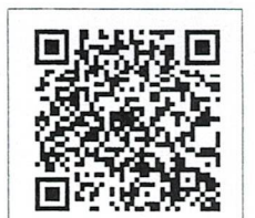
QR-Code เพื่อสอบถาม