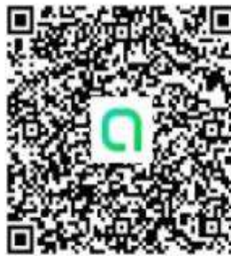
QR Code เพื่อเข้าร่วมกลุ่มไลน์ DL-ICT