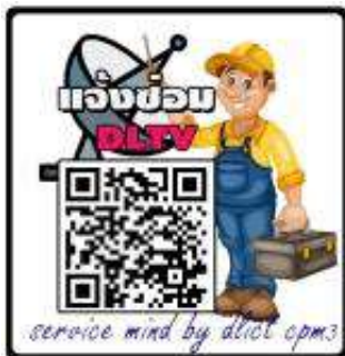
QR Code เพื่อแจ้งซ่อม DLTV