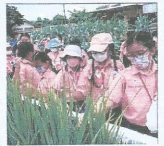
ชมพิพิธภัณฑ์กลางแจ้ง