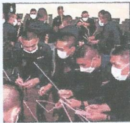
กิจกรรมสร้างสรรค์ความคิด