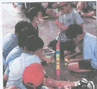
กิจกรรมสร้างสรรค์ความคิด