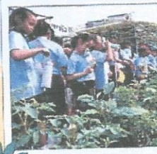
ชมพิพิธภัณฑ์กลางแจ้ง