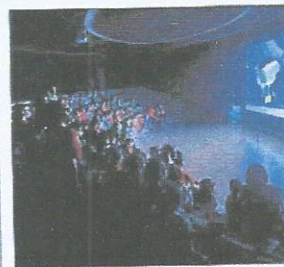
ชมภาพยนตร์แอนิเมชัน 3 มิติ