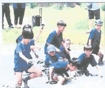
ลงมือฝึกปฏิบัติ