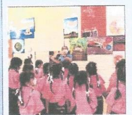
ชมพิพิธภัณฑ์ในอาคาร