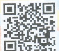
หลักสูตรการเรียนรู้เพิ่มเติม

สอบถามข้อมูลการลงทะเบียนและรายละเอียดเพิ่มเติม ☎ 02-529-2212-13, 094-331-7444, 087-359-7171