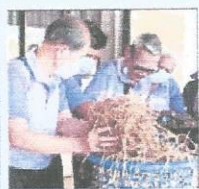
ลงมือฝึกปฏิบัติ